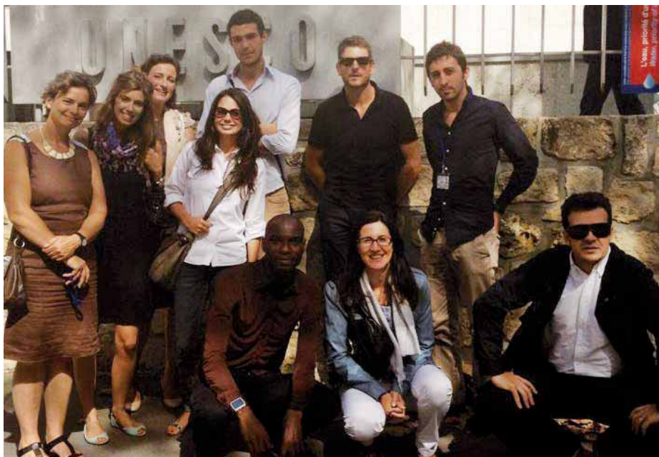
Alumnos de prácticas en la sede de la UNESCO en París.