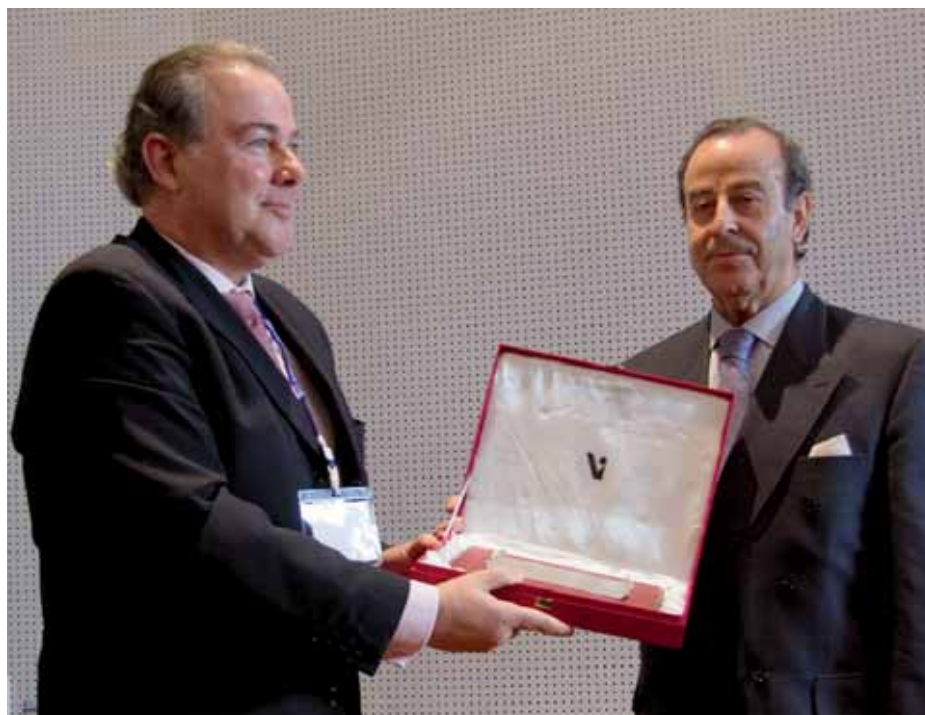
Este ranking mide el nivel de inglés de los alumnos.

La clasificación QS Stars -conocida como la Guía Michelin de la educación superior