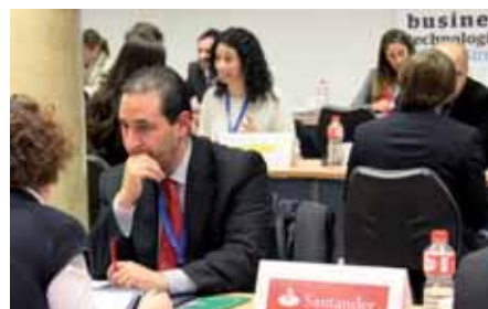
La Feria contó con la visita del Presidente de Cantabria, Ignacio Diego.