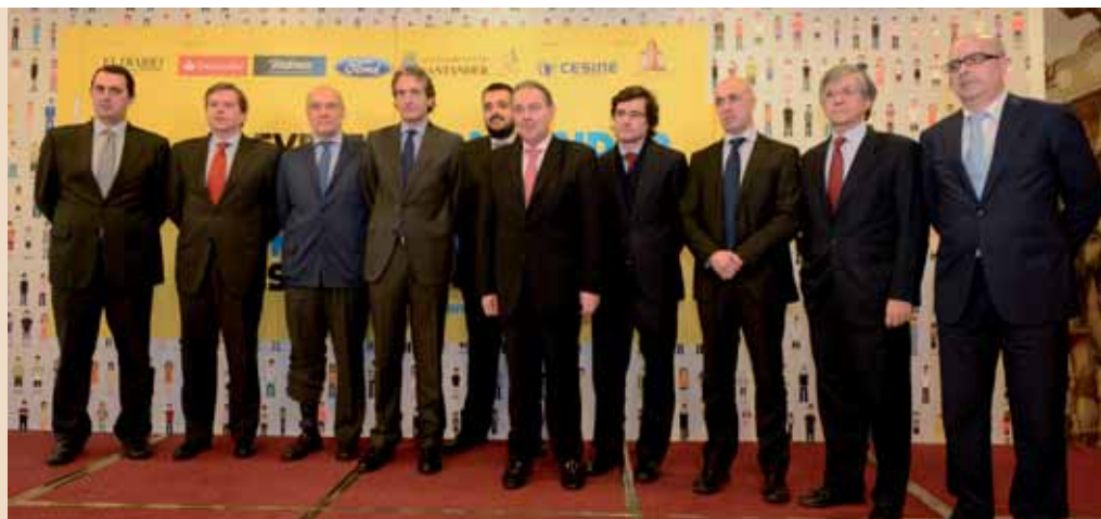
Esta iniciativa contó con un nutrido grupo de profesionales del sector.

Cesine estuvo presente en este evento aportando la vertiente académica que las herramientas del social media precisan, dado que este Centro Universitario lleva 20 años formando a profesionales para el mundo de la empresa y es consciente de la fuerte de-