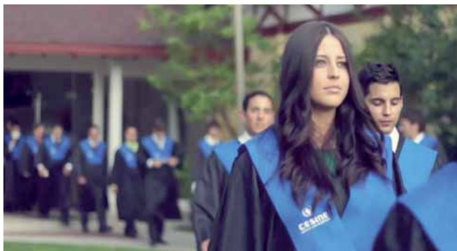
Más de 5.000 alumnos han pasado por las aulas de Cesine.

nalización de las instituciones. Además, Cesine ha obtenido la prestigiosa acreditación educativa QS Stars, convirtiéndose en la segunda institución universitaria española que consigue este sello de calidad. En sus 20 años de vida, Cesine cuenta con más de 5.000 antiguos alumnos, ha firmado convenios con más de 1.000 empresas, ha gestionado casi 6.000 prácticas de alumnos de diferentes titulaciones y alrededor de 2.000 ofertas de empleo. Asimismo, organiza anualmente la Feria de Empleo y Networking, y lleva diecisiete años organizando el Foro de Creación de Empresas, iniciativa pionera en la región, que fomenta el emprendimiento entre los estudiantes.